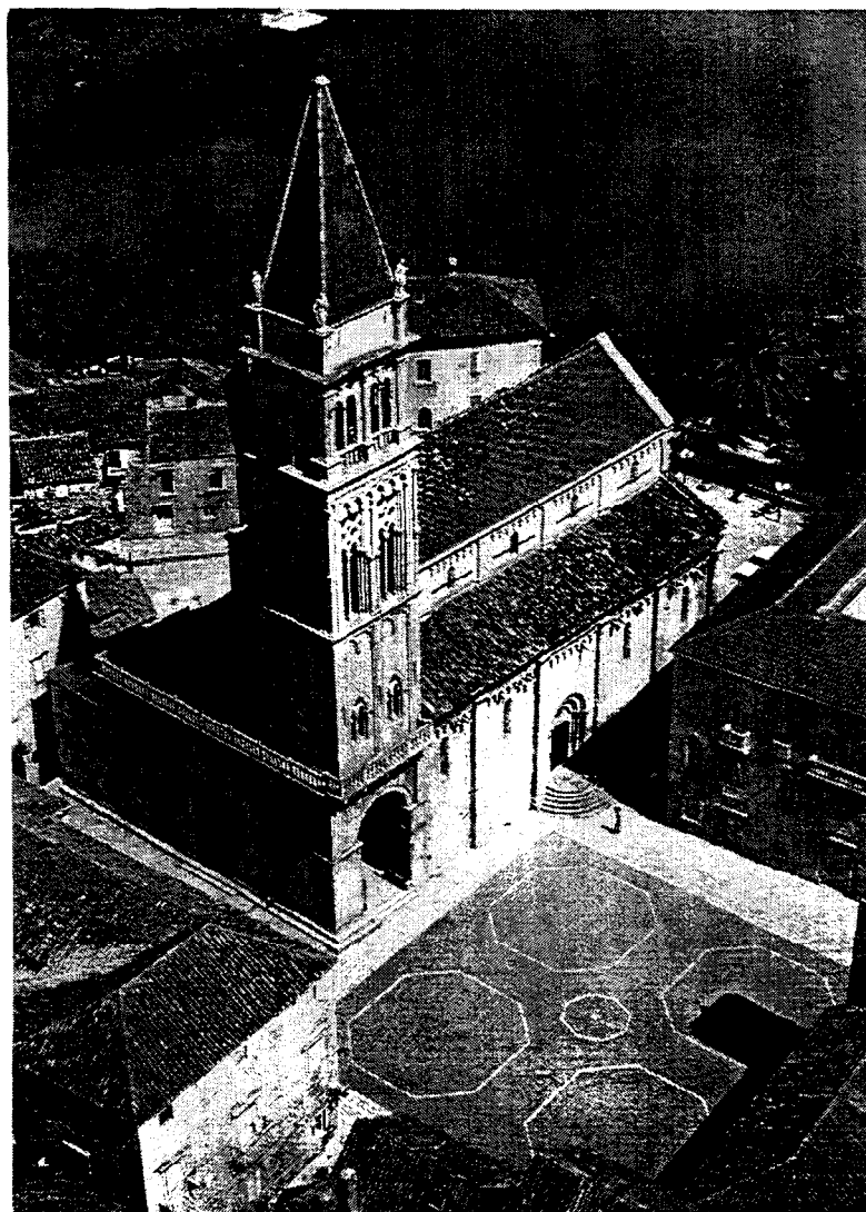
Trogir : Vue aérienne de la cathédrale / Aerial view of cathedral