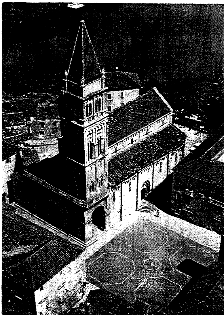
Trogir : Vue aérienne de la cathédrale / Aerial view of cathedral