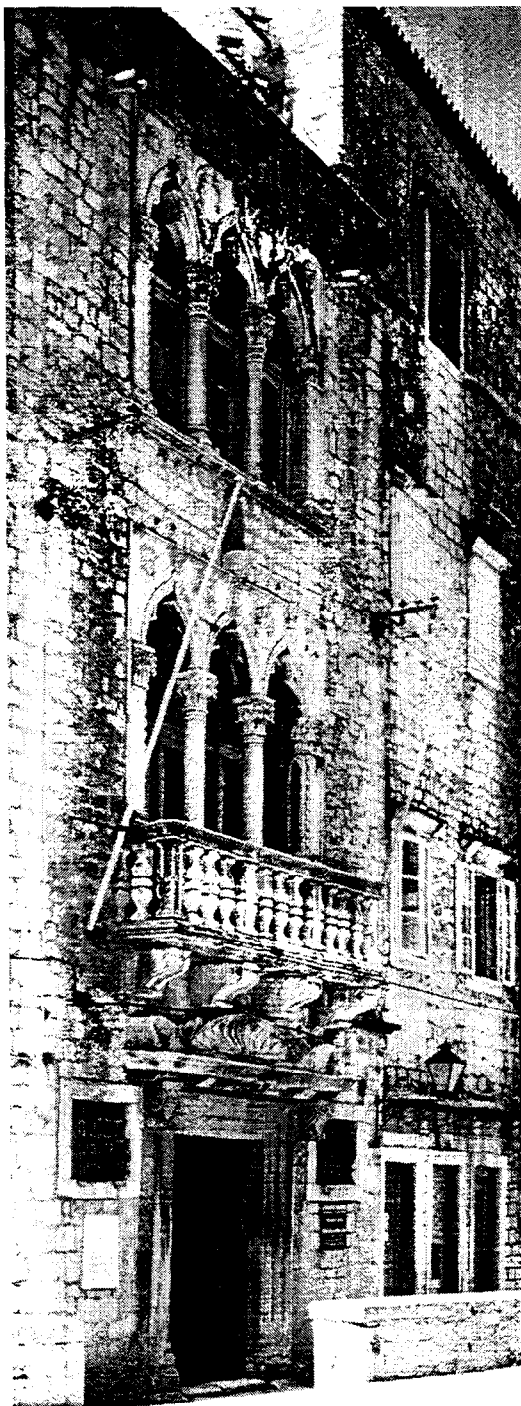
Trogir : Façade du palais Cipico / Facade of the Cipico Palace